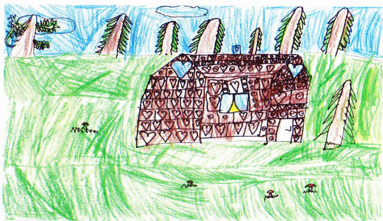
Tomáš Valásek – ilustrace k pohádce O perníkové chaloupce