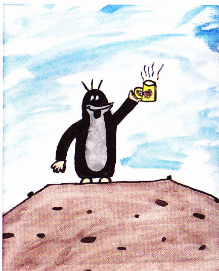
Kateřina Ottová - ilustrace ke knize O krtečkovi