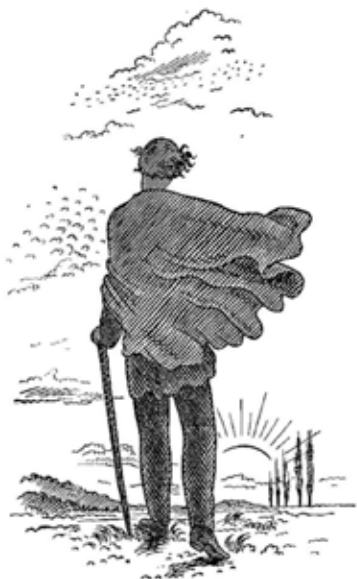
Poutník Mácha od Jana Konůpka