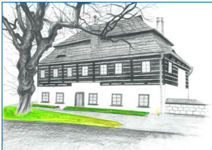
Památník Karla Hynka Máchy v Doksech