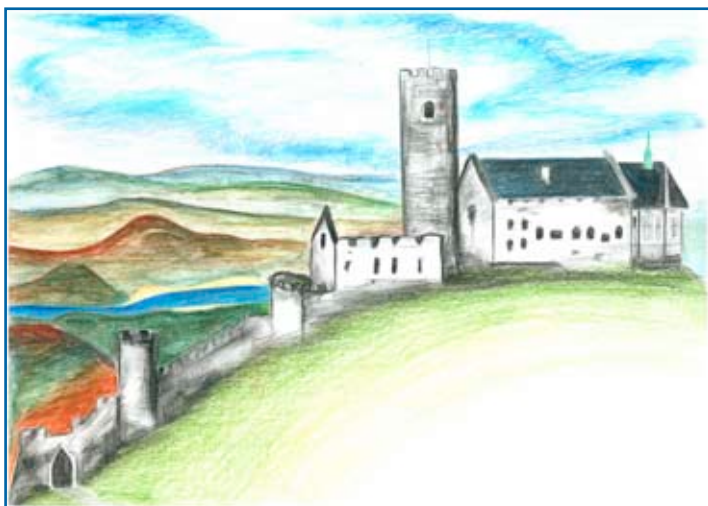
Hrad Bezděz Karlem Hynkem Máchou spatřený a navštívený