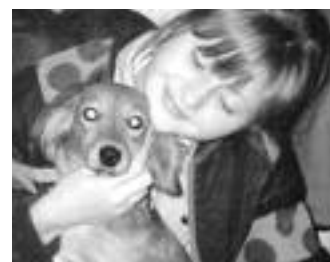
Dobrým „kamarádem“ nám může být třeba i oblíbené zvířátko.