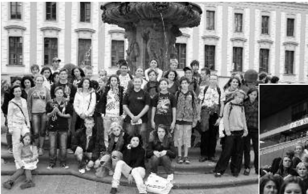
Žáci holzgerlingenské školy jsme mimo jiné pozvali na výlet do Prahy. Prohlédli si tam historické památky, ale navštívili také fotbalový stadion SK Slavia.

Žáci z naší školy a z německé školy v Holzgerlingenu se letos zúčastnili výměnného pobytu. Jílovské děti se odjely v červnu podívat do Německa a na oplátku přijeli němečtí školáci 5. října k nám. Byli ubytováni v rodinách jílovských kamarádů a 9. 10. se opět vrátili domů.