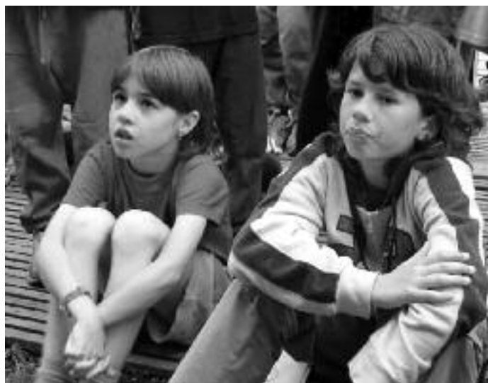
Jsou to kamarádky, nebo přítelkyně? Co myslíte? Ale vlastně na tom asi příliš ani nezáleží. Hlavně, že jsou spolu.