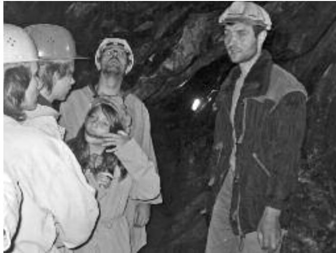
Poslední příležitost, kdy mohou letos zájemci navštívit jílovské štoly, je konec října. Ve sváteční den 28. 10. mají všichni vstup zdarma.