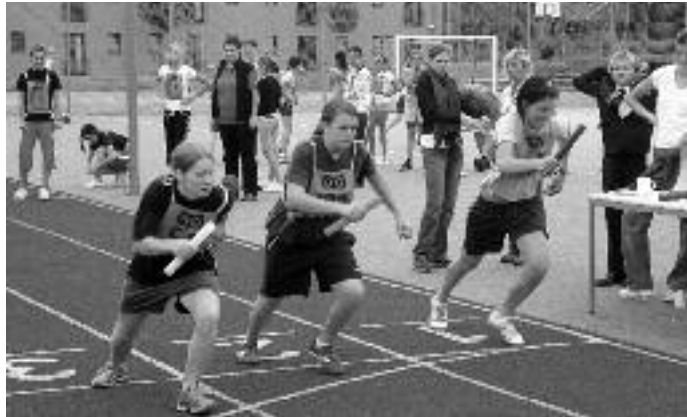
Na sportovní olympiádě Open Gate Babice se družstvo naší školy umístilo jako první. Gratulujeme účastníkům, kteří nás v soutěži reprezentovali.

● Ve čtvrtek 8. 10. se konala diskotéka na počest německých návštěvníků. Výzdobu připravovaly osmé třídy. Diskotéka se konala v tělocvičně naší školy. Já u té slávy sice nebyla, ale věřím že se akce vydařila. (kiki)