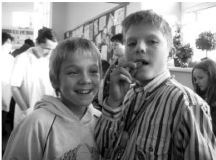
Ve škole má každý svého kamaráda nebo přítele.